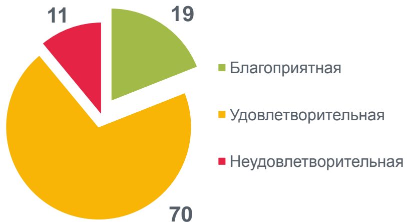
ОБЩАЯ ОЦЕНКА ЭКОНОМИЧЕСКОЙ СИТУАЦИИ, %